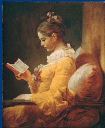
18. Jahrhundert Jean-Honoré Fragonard: Die Lesende