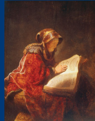
17. Jahrhundert Harmensz van Rijn Rembrandt: Prophetin Hannah