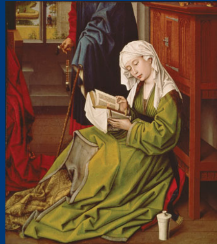
15. Jahrhundert Rogier van der Weyden: Lesende heilige Maria Magdalena

Exemplarische Malereien aus dem 15. bis 20. Jahrhundert