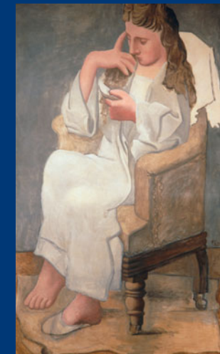
20. Jahrhundert Pablo Picasso: Lesende Frau (Olga)